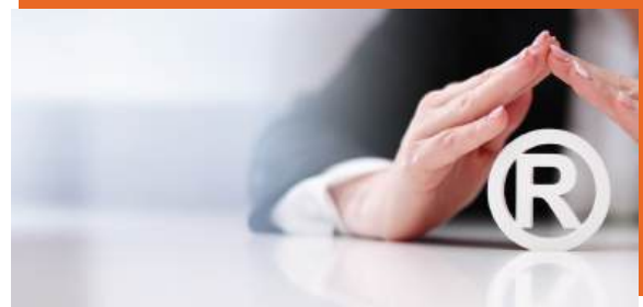
หลักเกณฑ์/ขั้นตอนการจดทะเบียน ในตลาดหลักทรัพย์