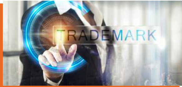
บุคลากรที่เกี่ยวข้องในการจดทะเบียน ในตลาดหลักทรัพย์