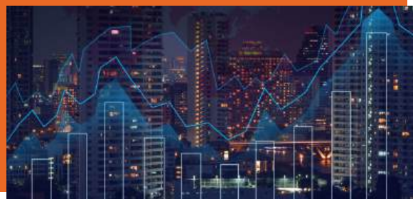
ภาพรวมตลาดทุนไทย และ สินค้าตราสารทุน