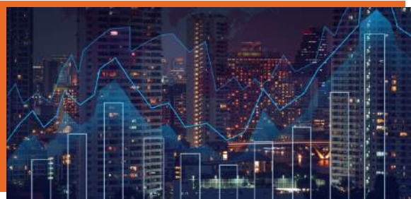
ภาพรวมตลาดทุนไทย และ สิ้นค้าตราสารทุน